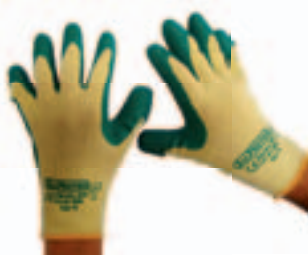
Art. 9504 Allprotec SHG TOP-Latexbeschichtung auf Baumwollstrick, nahtlos, teilbeschichtet, KAT. 2, Gr. 8 – 10