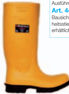
Art. 6838 Castor • PU-Stiefel, super leicht und flexibel • Nitril-Sohle • schützt gegen Kälte und Nässe • Weite 12 • Gr. 36 – 48

In einfacher Ausführung als Art. 4428 Bausicherheitsstiefel PVC erhältlich