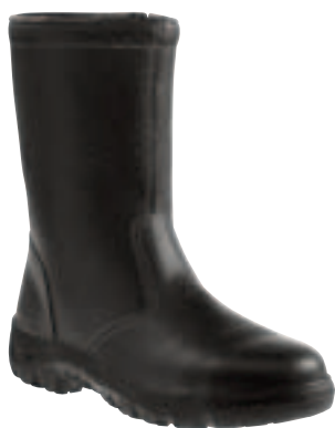
Art. 6816A Winterbaustiefel S3 • genarbttes Rindvollleder • Webpelzfutter • mit verdecktem Reißverschluss • 2-Schichten-PU-Sohle • Gr. 38 – 48