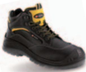
Art. 6833 Stiefel Montauk S3 • hochwertiges Rindvollleder • sehr leicht • atmungsfähiges, feuchtigkeits-transportierendes Innenfutter • 2-Schicht-PU-Sohle • Weite 11 • Gr. 38 – 48

In einfacher Ausführung als Art. 4428 Bausicherheitsstiefel PVC erhältlich