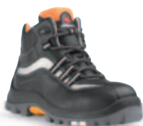
Art. 6831A Stiefel Hi-Tec S3 • Hi-Tec Obermaterial • TPU-Sohle • sehr leicht • Weite 11 • Gr. 39 – 47