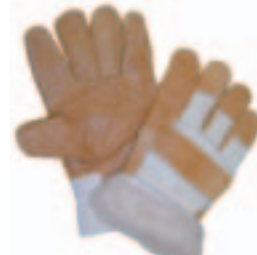
Art. 2219 BOA Möbelleder mit Teddyfutter, Innenhand verstärkt, weißer Drell, Gr. 11