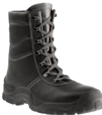
Art. 6820A Winter-Schnürstiefel S3 • genarbttes Rindvollleder • Webpelzfutter • Überkappe • 2-Schichten-PU-Sohle • Gr. 38 – 48