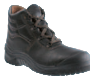
Art. 6815 Stiefel Basic S3 • Rindvollleder • Stahlkappe und Stahlsohle • Überkappe (ab Gr. 38) • PU-Sohle • Weite 11 • Gr. 36 – 48