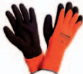
Art. 1358 Power Grab™ Thermo Acryl/Baumwolle, Latexbeschichtung, hochwertige Kälteisolierung, Strickbund, KAT. 2, Gr. 8 – 11