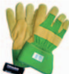
Art. 2242 Thinsulate Schweinsvollleder, voll gefüttert mit Thinsulate, gummierte Stulpe, EAN-Code, Gr. 11